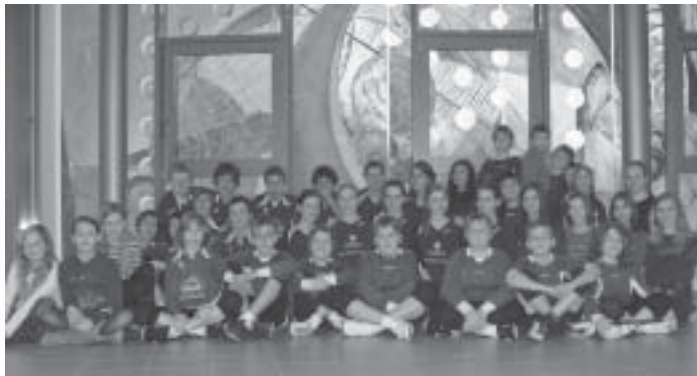
Der Segnitzer Faustballnachwuchs zeigte in Bretten sein Können. Über 30 Spielerinnen und Spieler erreichte beste Plätze.

Auch die mitgereisten Fans ernteten Lob und Dank vom Gastgeber. „Die mitgereiste Fangruppe machten die größte Stimmung unter den zahlreichen Zuschauern“ zitierte Gastgeber und Ausrichter Harald Muckenfuß. Hätte es für die Fans auch eine Siegerehrung geben, hätten diese sicherlich auch den ersten Platz belegt.